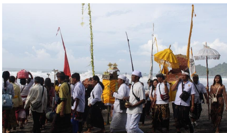
Gambar 2. Proses Melasti Pantai Jolosutro

Hari Raya Nyepi merupakan sebuah rangkaian pelaksanaan upacara, yang meliputi upacara Jalanidipuja atau melasti dan Tawur Kesanga. Sebelum melakukan upacara Nyepi, Umat Hindu diwajibkan mengikuti upacara Melasti yang memiliki makna untuk mensucikan Arca, Pratima, Nyasa atau Pralingga. Melasti biasa dilaksanakan tiga atau empat hari sebelum hari raya Nyepi, atau paling lambat ketika Tilem Kasanga sebelum sore (Gateri, 2021), namun pelaksanaannya disesuaikan dengan kebiasaan setempat menyesuaikan Desa, Kala Patra . Selain itu dijelaskan juga bahwa melasti menjadi momen pensucian rohani dan fisik agar terhindar atau tersucikan dari kekotoran pada alam semesta dan sesama makhluk.